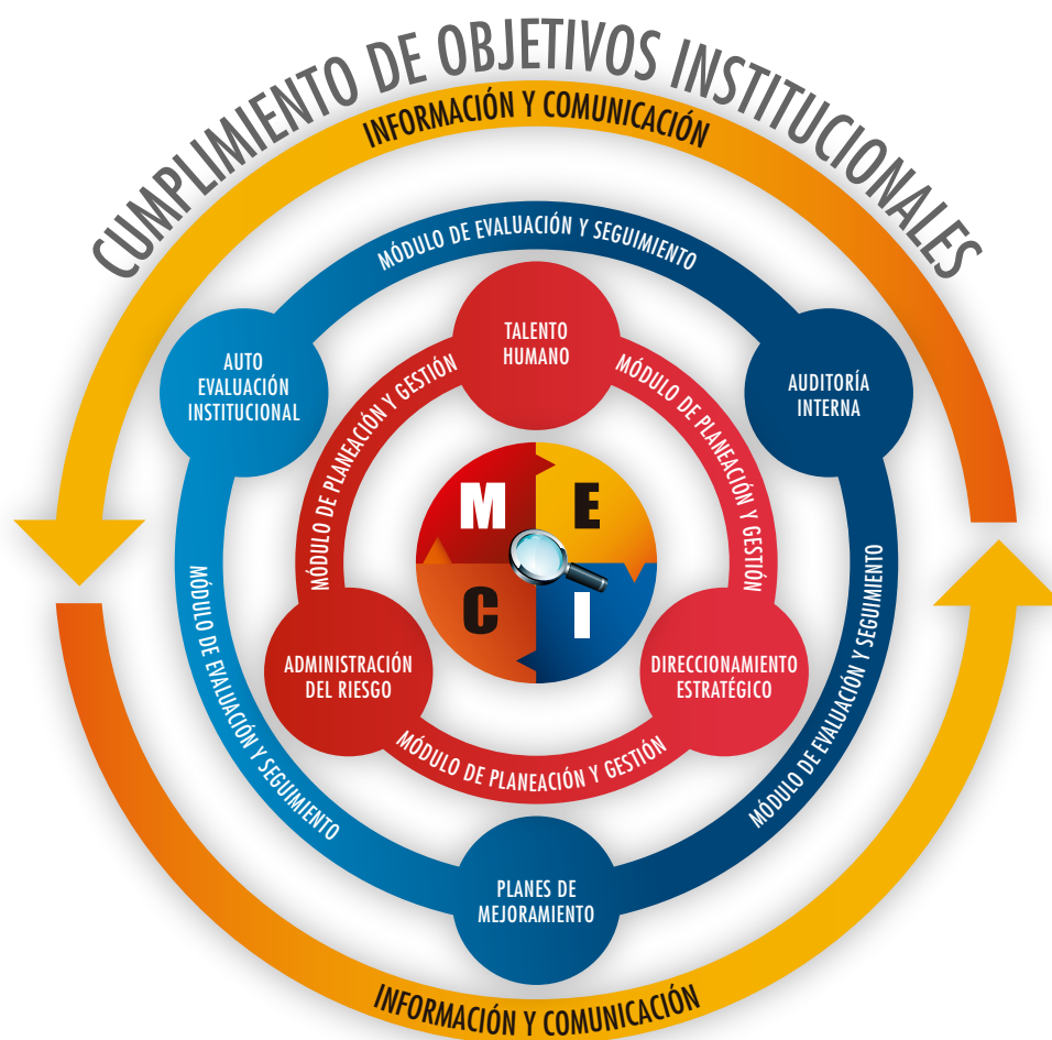
Ilustración 1. Estructura del Modelo Estándar de Control Interno

El gráfico que a continuación se muestra permite observar la estructura del MECI: